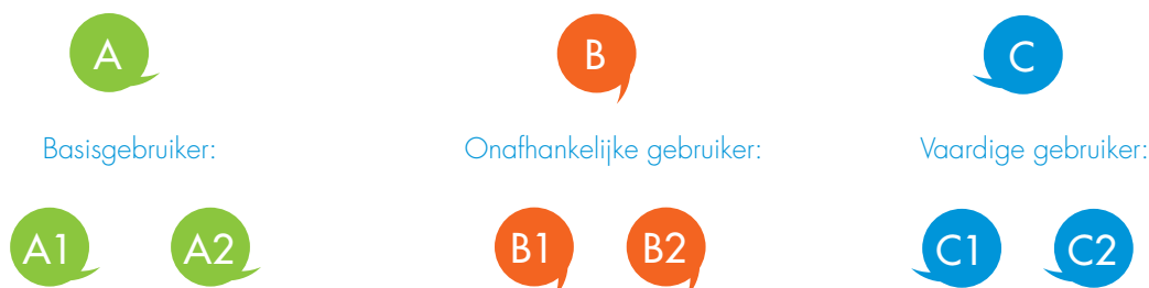
Figuur 1 Niveaus van het ERK

Leerlingen van sommige vvtto-scholen blijken gemiddeld soms lager te scoren dan leerlingen van scholen met Eibo